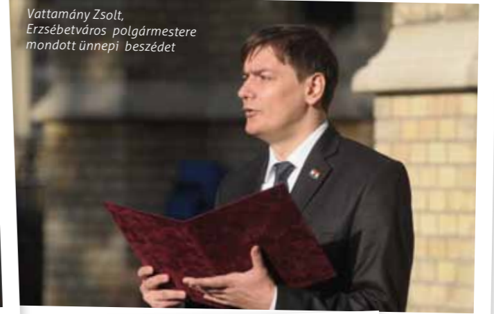
Vattamány Zsolt, Erzsébetváros polgármestere mondott ünnepi beszédet