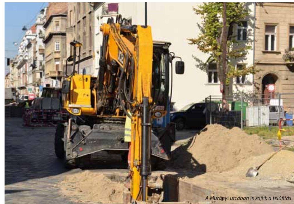
A Muraányi utcában is zajlik a felújítás

Október elején elkezdődött a Vörösmarty utca felújítása is, melyet a közlekedés és a parkolási lehetőségek javítása érdekében szakaszosan végeznek el. A sok helyen töredezett, megsüllyedt útszegélyeket kicserélik. A járda és az útburkolat teljes rekonstrukciója során az utca forgalmi rendje nem változik.