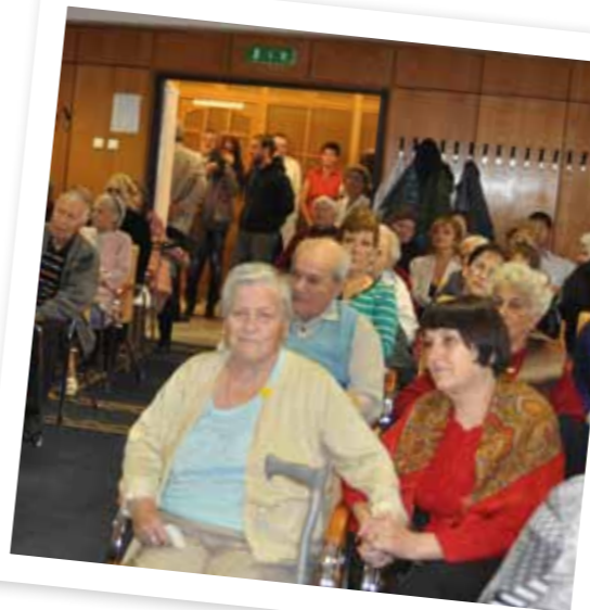
A Térszínház előadása a Nyitott Műterem Művészeti Klubban