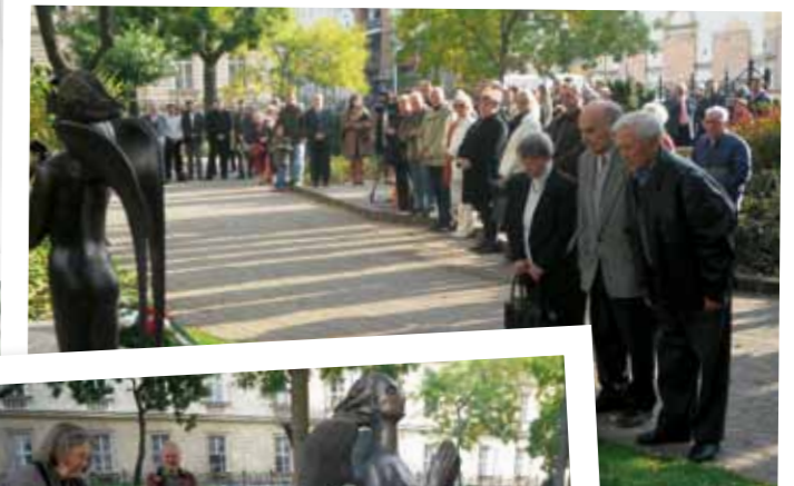
Erzsébetvárosi Hadigondozottak Egyesületének megemlékezése