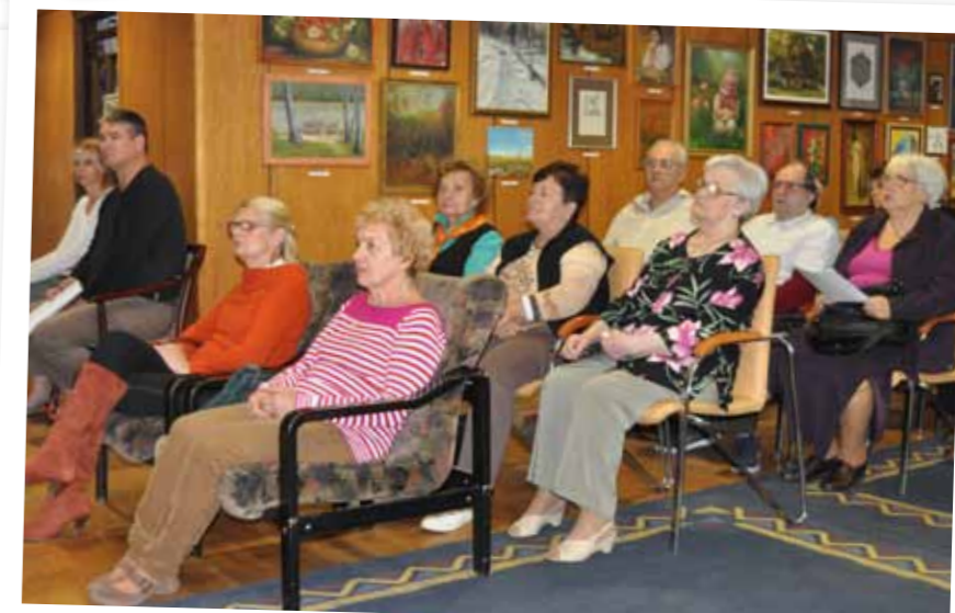
www.erzsebetvarosimedia.hu • www.erzsebetvaros.hu