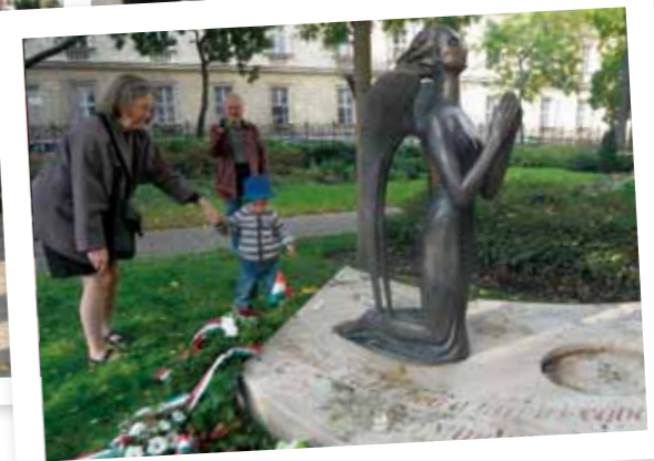
A megkoszorúzott „Angyal” szobor a Szent Erzsébet Plébániatemplom kertjében