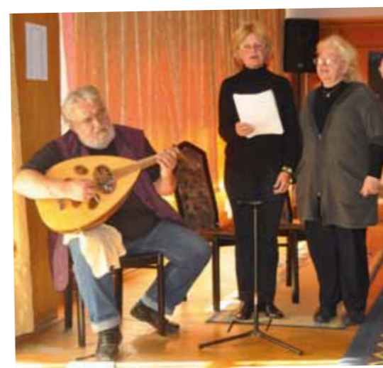
Erzsébetváros 2013. október 31.