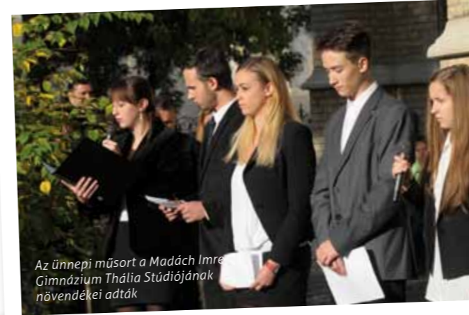
Az ünnepi műsort a Madách Imre Gimnázium Thália Stúdiójának növendékei adták

Az 1956-os forradalom és szabadságharc 57. évfordulójának alkalmából tartott ünnepi megemlékezésről készült képsorozatunk.