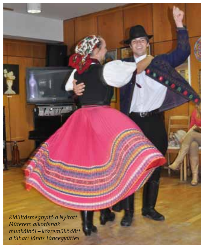
Kiállítás megnyitó a Nyitott Műterem alkotóinak munkáiból – közreműködött a Bihari János Táncgyűttes

A szociális alapszolgáltatások keretében minden kerületi idős számára elérhető a klubéletben való részvétel, az étkeztetés, a jelzőrendszeres házi segítségnyújtás és a házi segítségnyújtás; a szakosított ellátások közül pedig az átmeneti és tartós bentlakást is biztosítja az intézmény.